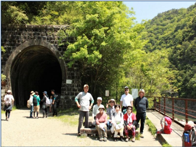
👉北山第一トンネル318m

ハイキング組は桜の園を約1時間ハイキング行い武田尾温泉足湯で癒しJR武田尾駅解散で帰路についた。一方登山組も楽しく登山を行い、阪急中山寺駅に無事下山