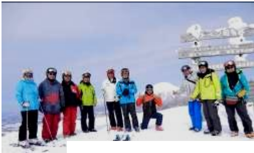
羊蹄山をバックにイゾラ山頂にて