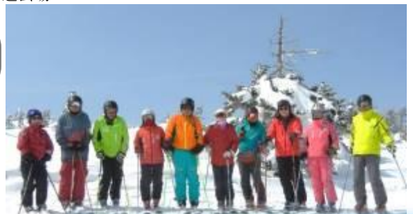
↑渋峠ゲレンデ山頂にて 寺子屋山頂にて↓

20日は東館から西館を滑り、13時宿を出発。いろいろありましたが、楽しいスキー行でした。S