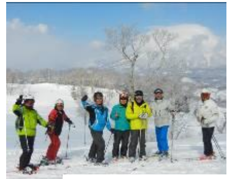
↑貸切りのウエスト北ゲレンデ

2日目は快晴、イゾラに移動。羊蹄山が山頂まできれいに見える。やっと羊蹄山に会えた！感動！！昨夜積もった新雪を、気持ちよくイゾラゲレンデの全コースを滑りました。