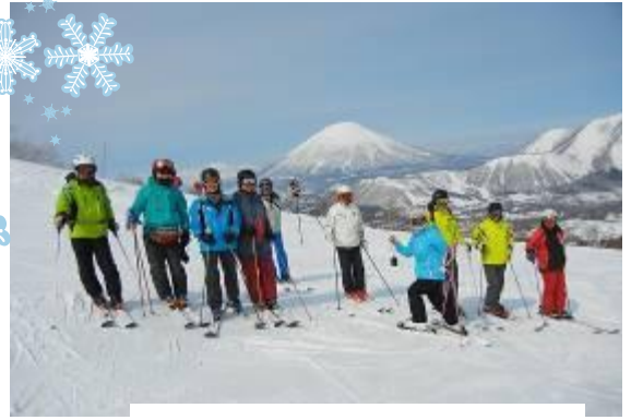
羊蹄山をバックにイゾラゲレンデにて

2017年3月5日(日)～9日(木)の5日間、昨年雪が少なかったのでリベンジで再度、北海道ルスツに行きました。参加は11名。