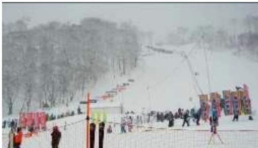
←ウエストゲレンデのデモ選会場